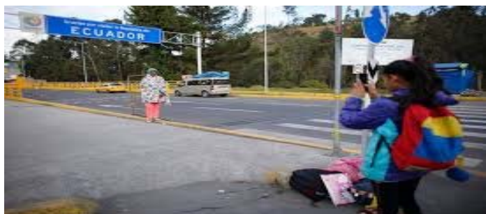
Diáspora migratoria de venezolanos (2022)

Los refugiados salen de su país de forma forzosa debido a una situación de gran violencia, como por ejemplo los refugiados sirios. Los migrantes salen de su país de forma voluntaria, aunque la situación en la que se encuentran también puede ser extrema.