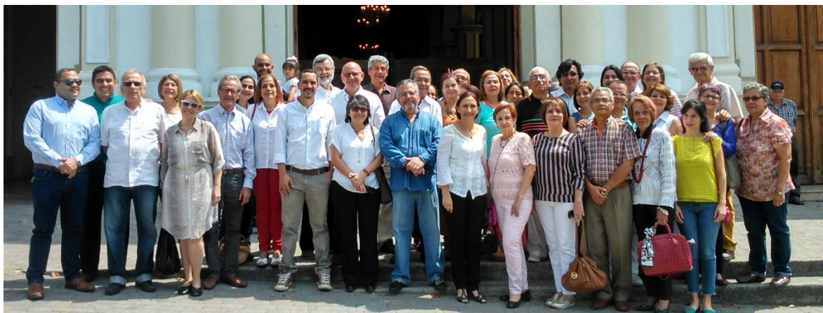
Miembros del Consejo Consultivo de la Ciudad de Barquisimeto en ocasión de su 3er Aniversario 17 Feb. 2019