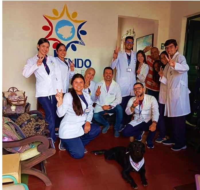
Figura 3. Docentes y estudiantes del Decanato de Ciencias de la Salud de la UCLA, en la Sede actual de la Fundación Tejiendo Redes, en la calle 41 entre carreras 13 y 14 a media cuadra del Parque Ayacucho, Barquisimeto, estado Lara, Venezuela.