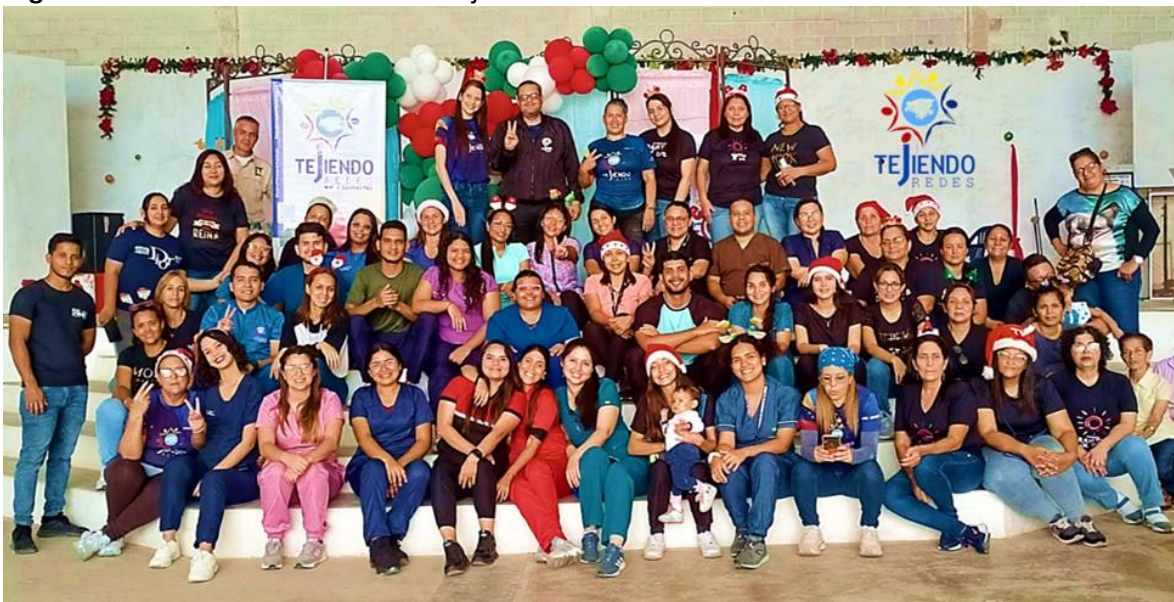
Figura 2. Miembros de la Fundación Tejiendo Redes.