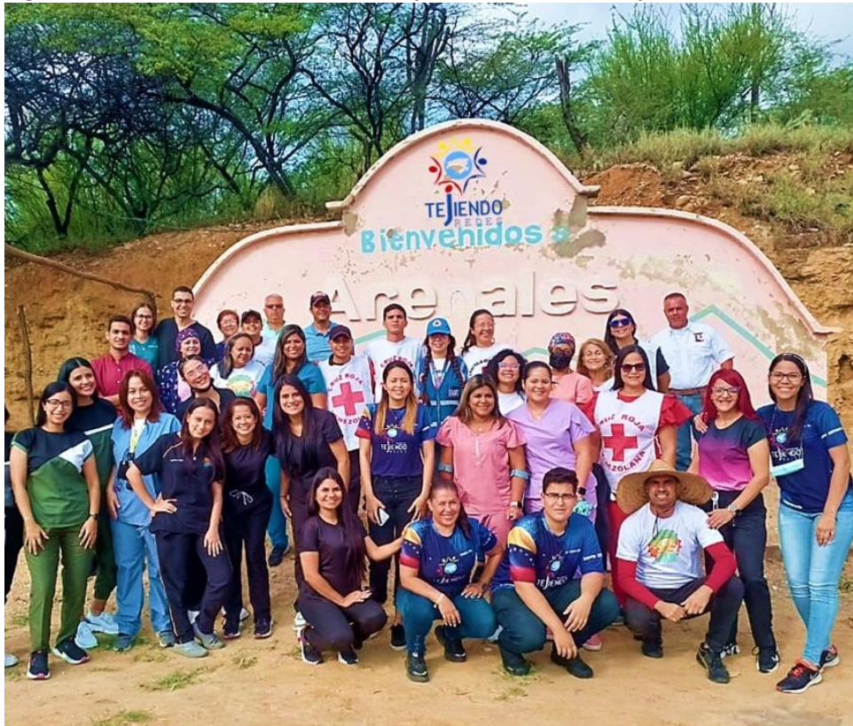
Figura 1. Miembros de la Fundación Tejiendo Redes, abordaje en Arenales.

cantidad de especialistas y voluntarios, que son, definitivamente, la principal fortaleza de la fundación (figuras 1,2 y 3).