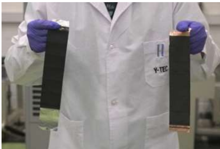
Muestras de litio en laboratorio

Nota. Tomado de Lavanguardia (26 de octubre de 2022)